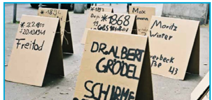
Die „Stolpertafeln“ erinnern an Schicksale von Holocaustopfern

Zur Ergebnispräsentation des Projekts haben die Kinder ihre erforschten Geschichten hinter den Stolpersteinen auf große Papptafeln geschrieben, mit denen sie sich an die Straße stellten und Passantinnen und Passanten Rede und Antwort zu ihrer Aktion standen. Es stellte sich dabei für die Kinder heraus, dass vielen der Passantinnen und Passanten das Ausmaß der Verfolgung und Ermordung von Juden während der NS-Zeit in ihrem Viertel gar nicht bekannt war. So hat die Aktion der Kinder direkte Auswirkungen auch auf die Menschen im Viertel gehabt. Auch eine ganze Reihe von Journalistinnen und Journalisten nahmen dieses Informationsangebot der Kinder ebenfalls gern wahr und berichteten darüber.