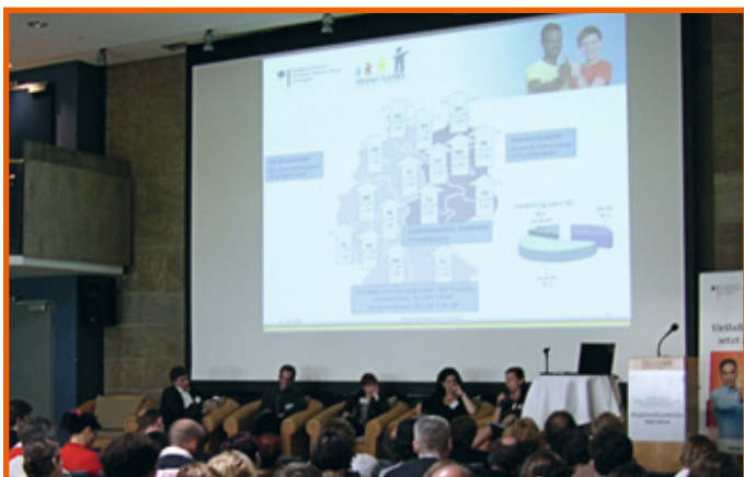
Angeregte Podiumsdiskussion auf der Regionalkonferenz Süd-West

arbeiteten die Teilnehmerinnen und Teilnehmer deshalb an beiden Nachmittagen in Kleingruppen gemeinsam an verschiedenen Themenkomplexen.