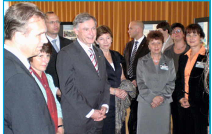
Ministerpräsident Dieter Althaus (links) und Bundespräsident Horst Köhler (Mitte) in Begleitung ihrer Ehefrauen beim Besuch in Ohrdruf