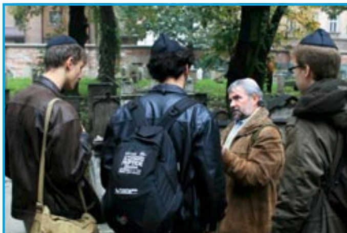
Auch über die Grenzen Halles hinaus können die Jugendlichen im LAP Halle aus der Geschichte lernen – hier auf der Bildungsreise in Krakau

zeigt, anhand derer die Darstellung des Nationalsozialismus untersucht wird. Begleitet wird die jeweilige Vorführung durch einen Vortrag und eine anschließende Diskussion. Im vergangenen Jahr fand im Anschluss an die Filmreihe zusätzlich eine Bildungsreise mit halleschen Schülerinnen und Schülern nach Krakau und in das Konzentrationslager Auschwitz-Birkenau statt.