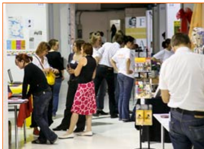
Besucherinnen und Besucher fanden auf der Projektmesse ein breites Informations- und Unterhaltungsangebot

Sowohl das Fachpublikum als auch die Besucherinnen und Besucher jeden Alters erlebten die Messe als infor-