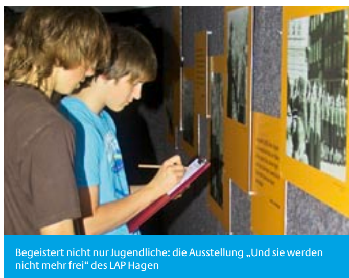
Begeistert nicht nur Jugendliche: die Ausstellung „Und sie werden nicht mehr frei“ des LAP Hagen

Schon zur Eröffnung am 7. Juni war der Andrang groß. Die Ausstellung „Und sie werden nicht mehr frei – Jugend im Nationalsozialismus“ des Historischen Centrum Hagen lockte allein an diesem Tag rund 350 interessierte Besucherinnen und Besucher