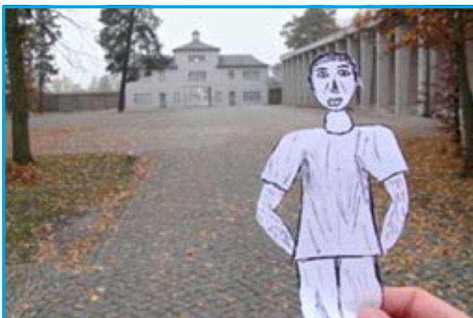
Im Modellprojekt „kunst – raum – erinnerung“ wird sich mit den Konzentrationslagern Auschwitz-Birkenau und Sachsenhausen künstlerisch beschäftigt

Neben dem Comic-Workshop „Comic09“ plant das Modellprojekt vom 21. bis 25. September 2009 den Kunst-Workshop „LandArt – Gedenkort gestalten“. Jugendliche werden sich mit den historischen Spuren und der Nachnutzung der Gedenkstätte Sachsenhausen beschäftigen und das Gelände der Internationalen Jugendbegegnungsstätte Sachsenhausen künstlerisch gestalten.