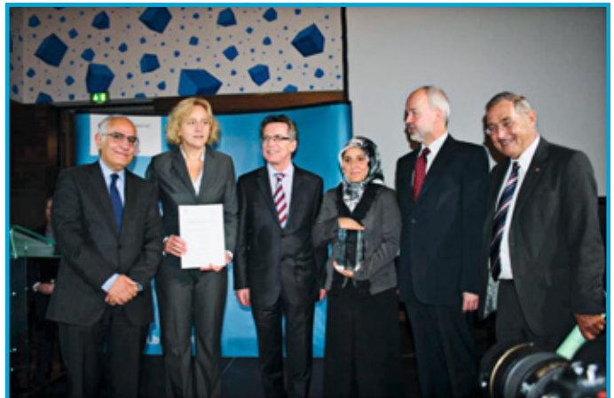
Dr. Thomas de Maizière und Preisträgerinnen und -träger bei der Verleihung des Deutschen Integrationspreises 2010 in Berlin

Das Reutlinger „Forum muslimischer Frauen“ ist eine bunte Gruppe von Frauen, die sowohl von ihrem Alter her als auch von ihrem Herkunftsland nicht unterschiedlicher sein könnten. Gerade diese Vielfalt ist ihre Stärke. Die Frauen verstehen sich als