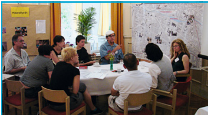
Worldcafé-Station der Stadtteilrallye auf dem „amira“-Praxistag am 10.06.2010

In der ersten Projektphase befragte „amira“ verschiedene Akteurinnen und Akteure aus den genannten Arbeitsbereichen zu aktuellen Problemlagen und Bedürfnissen ihrer Zielgruppen, ihrem bisherigen Umgang mit antisemitischen Äußerungen und ihrem Interesse an einer themenzentrierten Kooperation. Dadurch konnten einerseits die Erfahrungen der Gesprächspartnerinnen und -partner unmittelbar in die weitere Projektplanung einfließen und ihre Bedürfnisse ermittelt werden. Andererseits konnten auf diesem Wege aber auch schon Partnerinnen und Partner für die zweite Projektphase gewonnen werden.