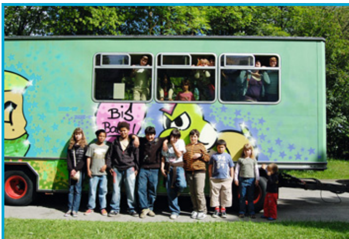
Kaufbeurer Jugend vor ihrem „JuZe-Truck“

Standorten Nachmittagsbetreuung für Kinder und Jugendliche zwischen 10 und 13 Jahren angeboten. Neben Spiel und Spaß werden auch Gesprächsrunden, Rollenspiele und Workshops zu Themen wie Missbrauch von Alkohol, Rauchen, Drogen, Kriminalität, Gewalt, Mobbing und Sexualität durchgeführt.