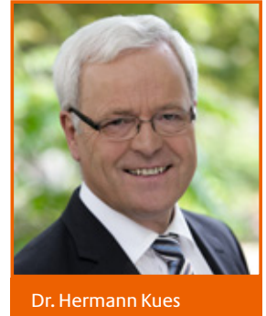
Dr. Hermann Kues

Wir wollen das Begonnene engagiert weiterführen, und dazu wünsche ich mir eine so tatkräftige Unterstützung aller Beteiligten, wie wir sie in den vergangenen vier Jahren erfahren haben. Allein finanzielle Mittel zur Verfügung zu stellen, ist noch lange keine Garantie für eine starke Demokratie. Wir brauchen Menschen in allen Altersgruppen und unterschiedlichster sozialer und kultureller Herkunft, die die Werte der Demokratie mit Leben füllen und gleichzeitig andere Menschen motivieren, sich ebenfalls aktiv für ein vielfältiges und tolerantes Miteinander in unserer Gesellschaft einzusetzen.