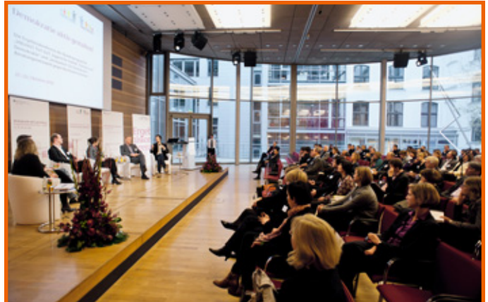
Impulsgebende Vorträge und spannende Podiumsdiskussionen

Insgesamt bot die Ergebniskonferenz 2010 damit eine adäquate Plattform, um das Erreichte zu präsentieren und damit die Grundlage für die zukünftige Zusammenarbeit der beiden Bundesprogramme unter dem gemeinsamen Dach „TOLERANZ FÖRDERN – KOMPETENZ STÄRKEN“ ab 2011 zu schaffen.