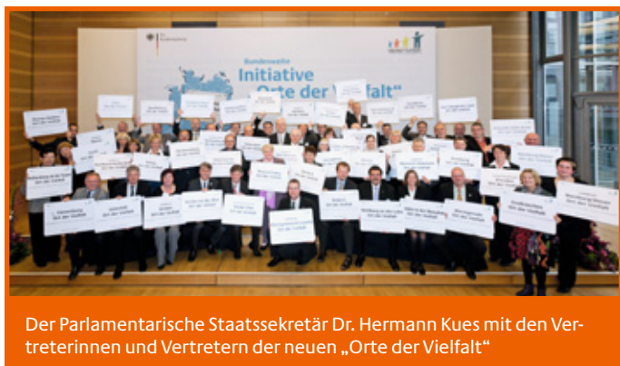
Der Parlamentarische Staatssekretär Dr. Hermann Kues mit den Vertreterinnen und Vertretern der neuen „Orte der Vielfalt“