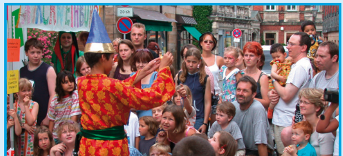
Von Kindern für Kinder – Kinderfest in Fürth

inhaltliche Ausrichtung steuern. Auch die Einbindung in bereits bestehende Netzwerke wird großgeschrieben. So haben bereits Kooperationsgespräche stattgefunden, bei denen der Aufbau eines Bildungsangebotes für Multiplikatorinnen und Multiplikatoren zum Thema Rechtsextremismus und Demokratiefeindlichkeit in der Region diskutiert wurde. Die Auftaktveranstaltung „Fürther Vielfalt tut gut“ gibt Ende November den offiziellen Startschuss für den neuen LAP. Ab 2011 sollen die erarbeiteten Strategien in die Tat umgesetzt werden.