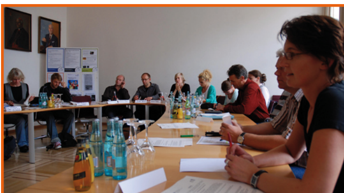
Was macht einen erfolgreichen LAP aus? – Ein reger Wissens- und Erfahrungsaustausch zwischen allen Beteiligten ist wesentlich

Das Interessenbekundungsverfahren für die Förderphase ab 2011 läuft vom 1.10. bis zum 2.11.2010. Näheres erfahren Sie auf Seite 6 dieses Newsletters.