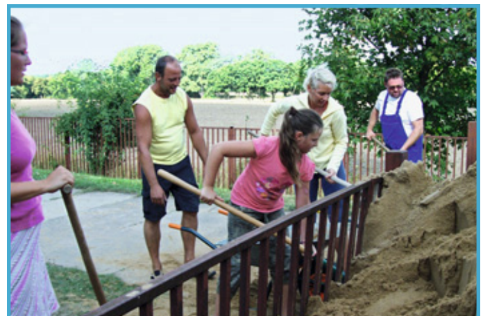
Gemeinsam engagiert: Freiwillige Helferinnen und Helfer bei der Arbeit am Freiwilligentag in Burg

Neben der Freiwilligenagentur setzt sich im LAP Burg auch eine sogenannte Integrationslotsin für die Stärkung des bürgerschaftlichen Engagements ein. Ihre Aufgabe ist es, die in Burg lebenden Migrantinnen und Migranten noch besser in das gesellschaftliche Leben einzubinden. Hierzu gehören die Unterstützung bei der offiziellen Ämterkorrespondenz oder bei der Wohnungssuche und die Heran-