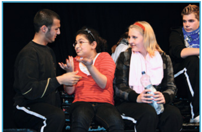
Engagiert und kreativ: Jugend-Kulturlotsen bei der Aufführung eines Forumtheaterstücks

Mit der Methode des Forumtheaters erwirken die Jugend-Kulturlotsen den direkten Dialog über Gerechtigkeit und Respekt mit ihrem jugendlichen Publikum. Damit wollen sie konstruktiv in die täglich notwendige Klärung von interethnischen Konflikten